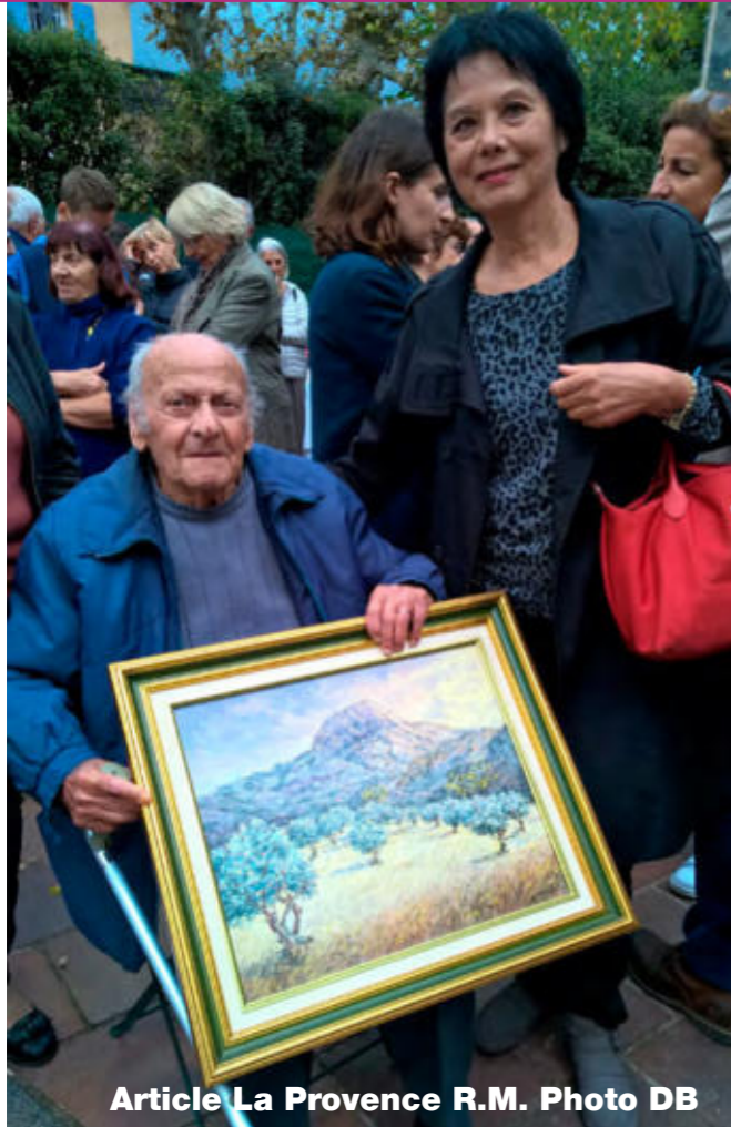
Article La Provence R.M.