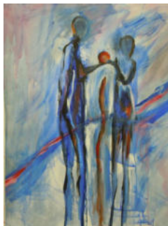
Une œuvre sur le thème Adam et Eve.

Un essai ? C'est gratuit. Venez découvrir cet atelier et vous verrez si ce concept vous convient.